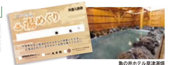
亀の井ホテル草津湯畑