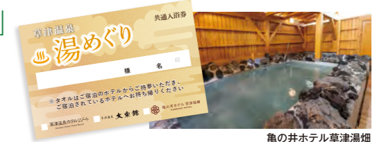
亀の井ホテル草津湯畑